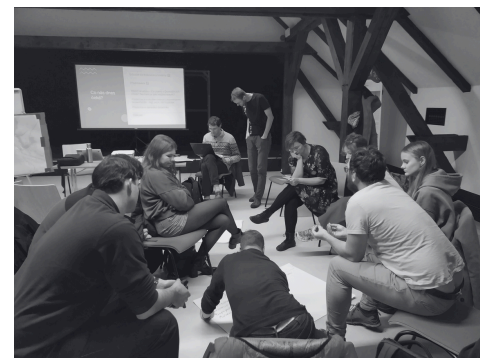
Debata v KC Pivovar Domažlice

Projekt Pohraničí tě nezničí se snaží odhalit motivace mladých lidí po dokončení studia zůstat či naopak se odstěhovat z Domažlicka a zkoumá, jak by se dal tento trend odlivu mozků zvrátit.