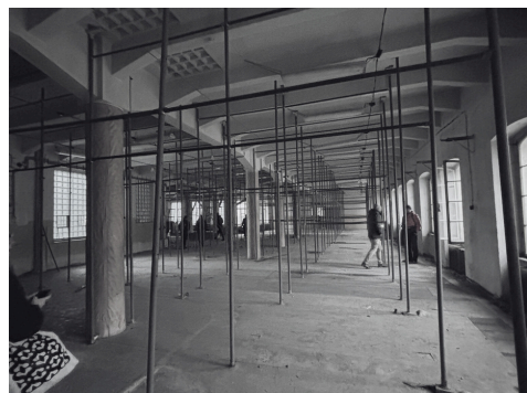
Prohlídka jedné z místností.