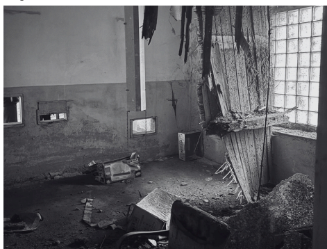
Havarijní stav některých místností.