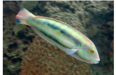
Kněžník kluzký (slippery dick)