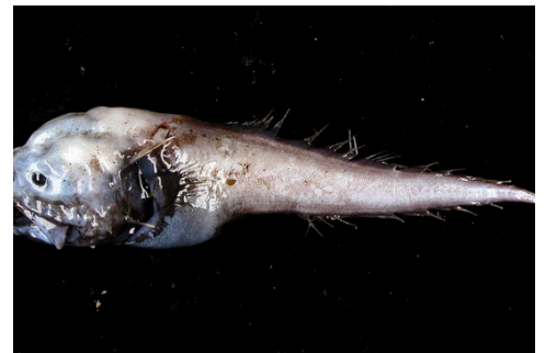
Úhoř kostnatý (bony-eared assfish)