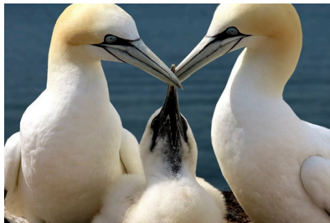
Terej bílý (booby)